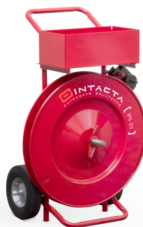
IPS - 55