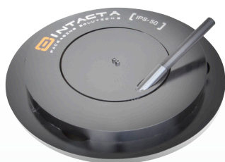
IPS - 50