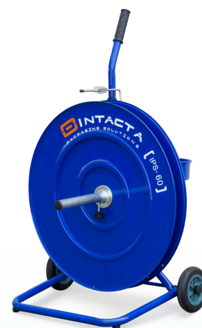
IPS - 60