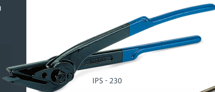
IPS - 230